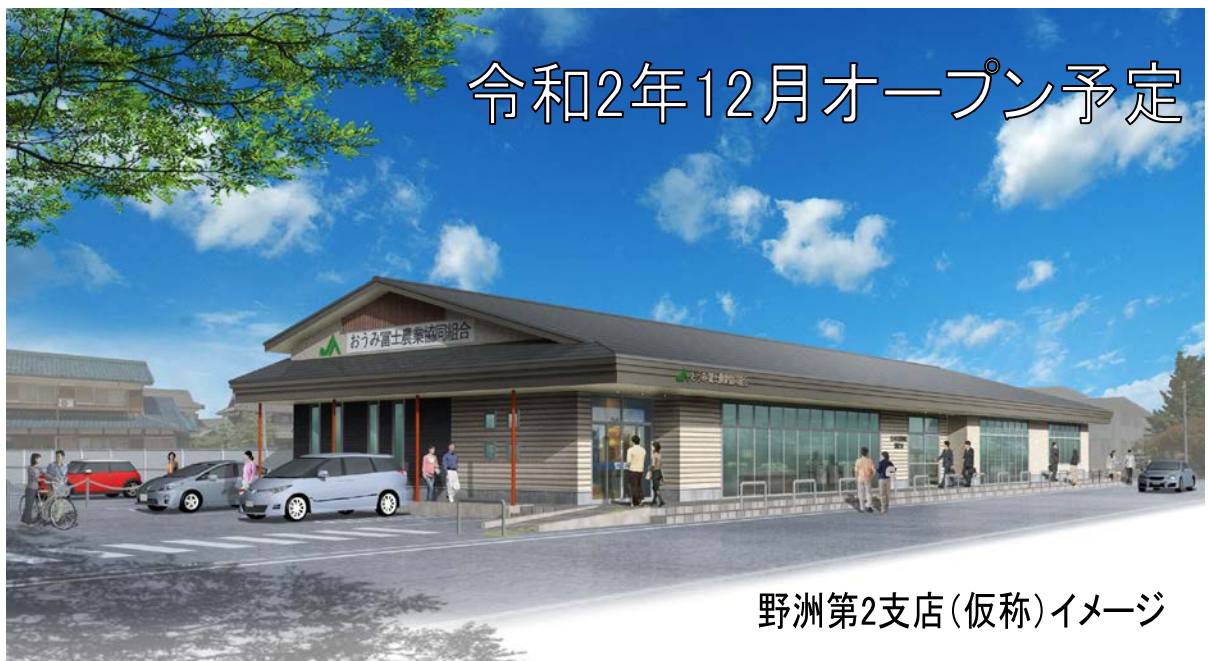
野洲第2支店(仮称)イメージ