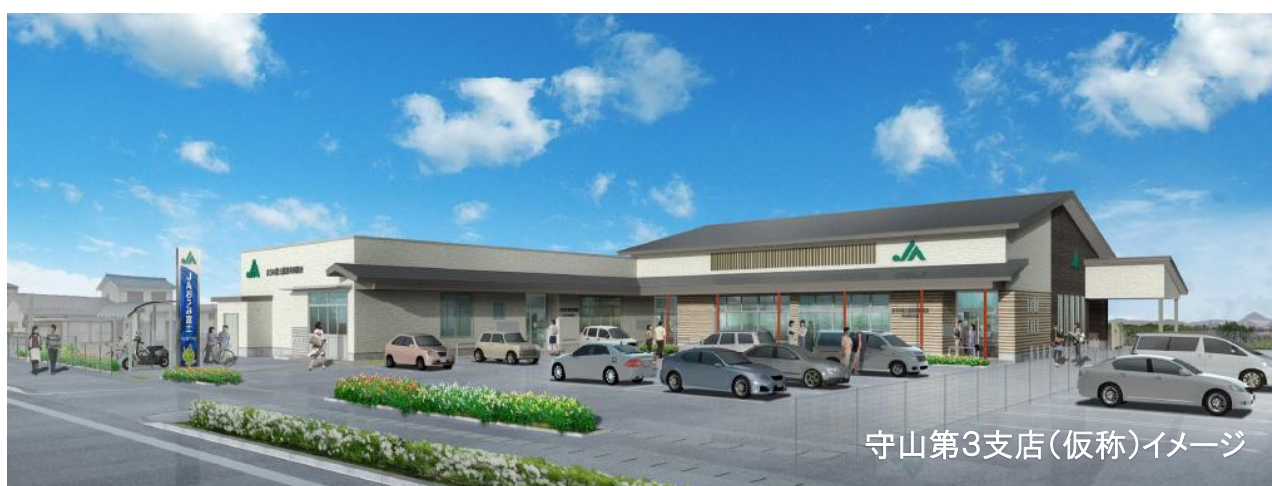
守山第3支店(仮称)イメージ

※上記は概略を示すもので、各工程に遅延等が発生する場合がございます。ご理解の程よろしくお願いたします。