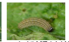
ハイマタラ/メイカ